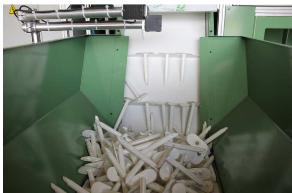
Trémie élévatrice capacité 150 dm3