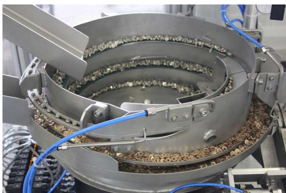
Bol vibrant distribuant vis et rondelles