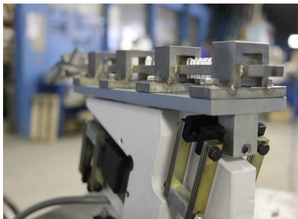
Rail vibrant distribuant embouts diam 5 mm