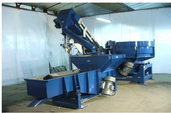
Ensemble vibrant distribuant fibre de verre